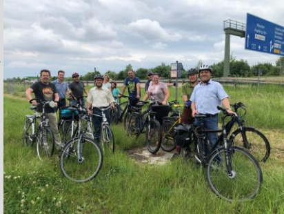
Bild: Rund um Hirblingen, Fahrt am 5. Juni 2022

Wir sind mit dem Fahrrad unterwegs; wir kehren auf halber Strecke ein und machen kleinere Pausen.