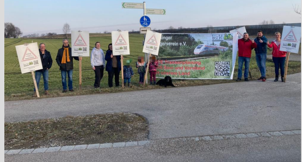
Bild: Bürgerverein Hirblingen, 3. März 2023 Am Kreisverkehr in Richtung Täferlingen

Aufgrund des Krieges, leben zur Zeit viele ukrainische Flüchtlinge unter uns. Aber auch Menschen aus anderen Ländern kamen in den letzten Jahren nach Hirblingen.