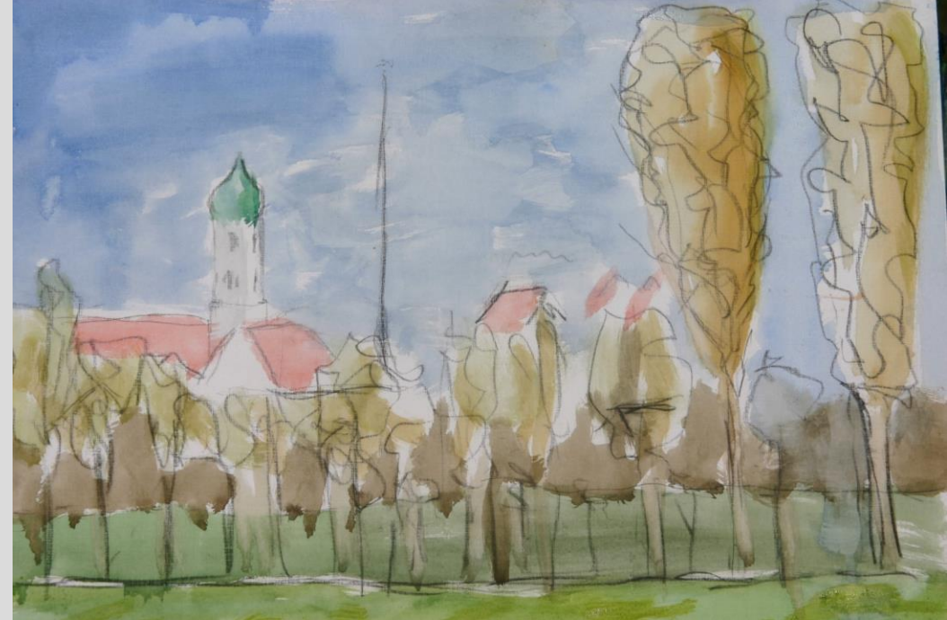
Bild: Martin Wölmüller, Bayerischer Landesverein für Heimatpflege e.V., 2007

www.hirblingen.de/buergerverein | buergerverein@hirblingen.de